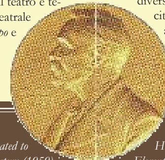
a sinistra: Medaglia d'oro del premio Nobel

Testimonianze esemplari esposte nella mostra: la medaglia di rappresentanza del Nobel in bronzo dorato, una medaglia di bronzo, diverse fotografie dell'avveimento e alcuni telegrammi di felicitazioni per il poeta, tra cui quello più caro del "soave amico" di Vento a Tindari Salvatore Pugliatti che gli fu sempre vicino.